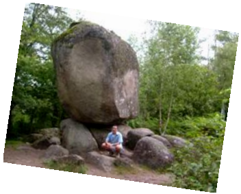
La pierre branlante de Boscartus