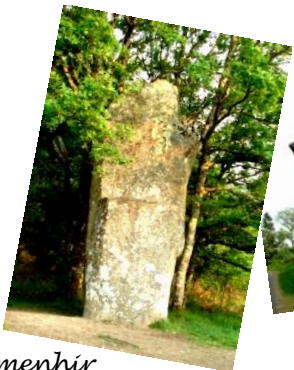
Le menhir de Ceinturat