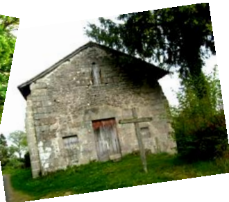
La Chapelle du Bois du Rat